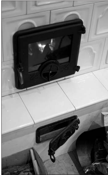
Reneszánszukat élék a fatüzelésű cserépkályhák is, melyek akár a központi fűtésre is ráköthetők.

A kiépítés előtt meg kell vizsgálni az épület hőtechnikai tulajdonságait, a hőszivattyús rendszernek ugyanis vannak korlátai, extrém magas hőmérsékletet nem lehet vele előállítani, ezért megesik, hogy le kell mondani róla, ha nincs hőszigetelés, vékonyak a falak vagy rosszak a nyílászárók. Ezek után ki kell választani a leghatékonyabb hőforrást, ami manapság az esetek többségében a levegő. Ha már kész fűtési rendszer van, az többnyire maradhat, csak a hőtermelő egységet, azaz a kazánt kell lecserélni, de azzal párhuzamosan is kiépíthető. Fontos tény, hogy ezek a rendszerek nemcsak fűtésre alkalmasak, hanem hűtésre és használati melegvíz előállítására is. A beruházás költségei valóban magasabbak, mint például a gáz esetében, a hőszivattyú ára többszöröse a kazánénak, nagyjából 1,3-1,5 millió forint, de az energiatakarékos rendszerek kiépítéséhez lehet