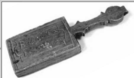
Csigacsináló tábla (16,4 cm x 5,2 cm x 1,8 cm)

heti kiválasztottunk, az ezen a vidéken való ritkasága. Környékünkön ugyanis a lakodalmi levesbe általában cénametéltet – „laskát” – főztek, éppen a csigatészta elkészítésének időigényessége és drága mivolta miatt. (Ugyanis a csigacsináló asszonyok egy hét alatt sok bort megittak.) Vajon hogy kerülhetett mégis Paksra? Lehet, hogy korábban itt is csigát készítettek a lakodalmakra? Vagy esetleg egy Alföldről származó legény készíthette kedvesének a hazai szokások alapján?