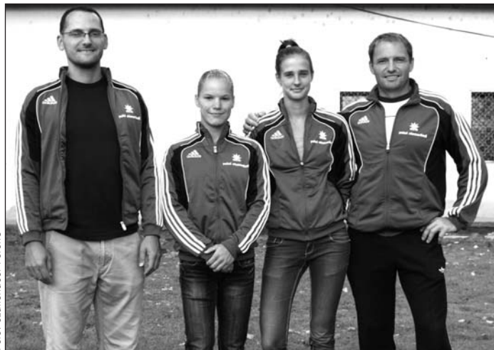
Edzőik körében az aranyérmes lányok.

vízben volt a verseny, szerencsére nem volt sekély, lehetett menni. Nehezen indultunk be, de futásban sikerült meglépni, utána már könnyebb volt.