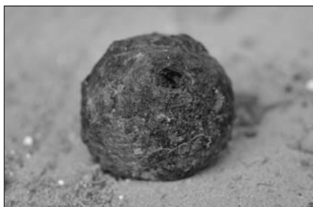
A megsemmisítésre váró éles ágyúgránát.