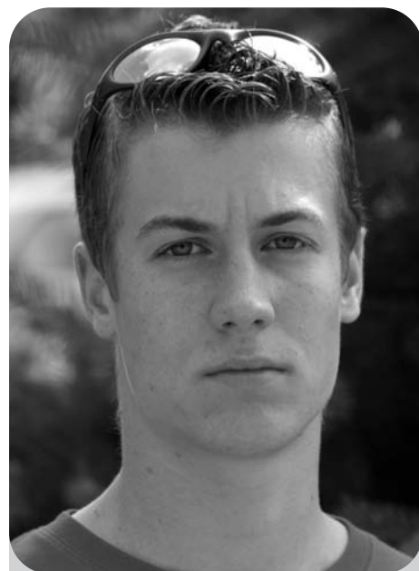
Kozma Tamás Vak Bottyán Gimnázium

A diákvezetőket bemutató írásunk a 12–13. oldalon.