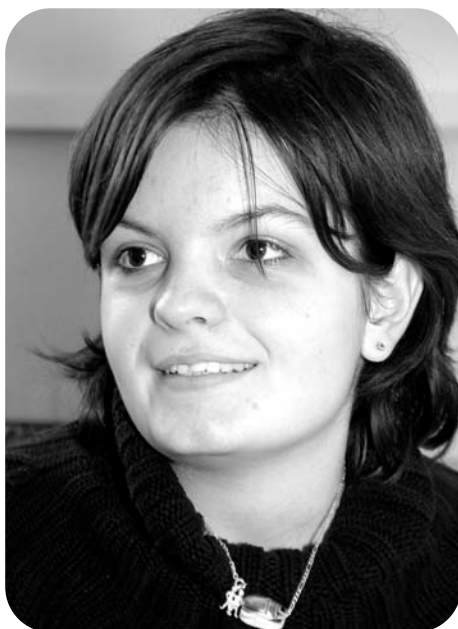
Mach Melinda I. István Szakképző Iskola