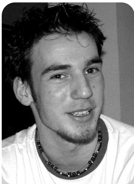
Simon Balázs Energetikai Szakközépiskola