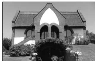
A Rókus utcában különleges kialakítású, Dunai panorámás családi ház eladó. Irányár: 32 M Ft.