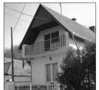
Dunakömlődön, a Sánchegy utcában 2,5 szobás, összkomfortos családi ház eladó. Irányár: 11,5 M Ft.