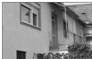
A Kossuth L. utcában 3 szobás földszinti, felújított lakás, garázzsal, kerttel eladó. Irányár: 18,9 M Ft.

Részletes felvilágosítás: FONYÓ LAJOS INGATLAN ÉRTÉKBECSLŐ, KÖZVETÍTŐ.