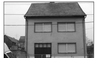
A Keskeny utcában kétszintes, 4 szobás, gázfűtéses családi ház, garázzsal, gazdasági épülettel eladó. Irányár: 28 M Ft.