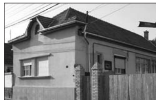
A Kossuth Lajos utcában 4 szobás összkomfortos családi ház eladó. Irányár: 21,1 M Ft.