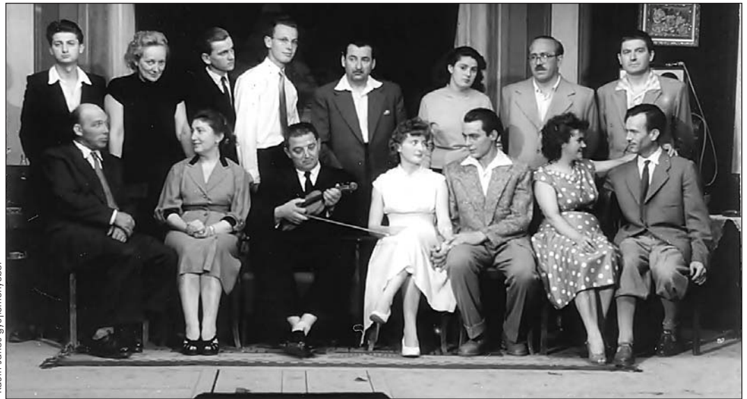
A fotón a paksi társulat látható 1959-ben a Tavaszsi keringő című előadás után