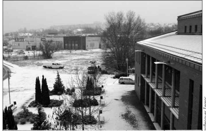
Ezen a területen épül fel az év végére gyógyászati központ. A két épületet függőfolyosó köti majd össze.

Ismét lesz adventi udvar a városháza előtti téren: idén december 8. és 14. között várják majd a látogatókat.