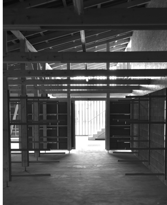
Az új csónakházban 32 hajó és ugyanennyi csónakmotor fér el.

A gyógyászati központ épületét a tervek szerint az év végéig fejezi be a kivitelező cég, ez idő alatt a hulladékgazdálkodási rendszer épületei is elkészülnek. A szeméttelphen már tető alatt van a szociális épület, kialakítása a belső szerelési munkákkal folytatódik. Elkezdődött a hulladékudvar alapozása és elindultak a szelektív, valamint a kommunális hulladék befogadására készülő csarnok építését előkészítő földmunkák. A komposz-