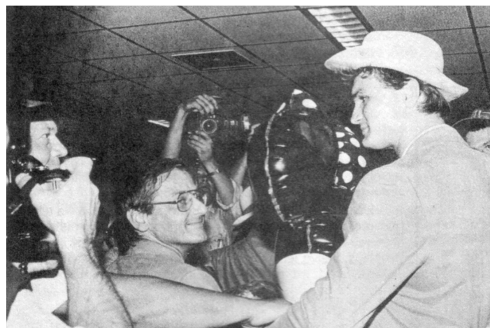
Az ünneplés pillanatai a Paksi Hírnök 1992-es számában.

– Az interneten egy videomegosztón fenn van a döntő mérkőzés. Megnézed néha?