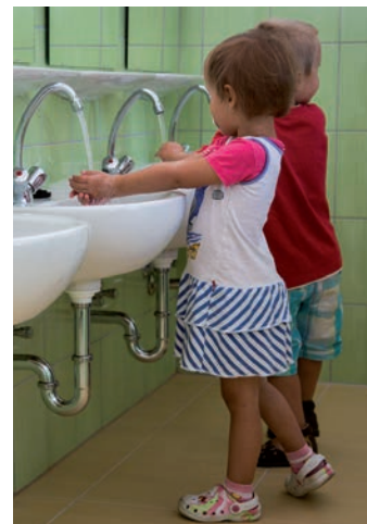
Pusztahencsén az óvoda korszerűsödött az alapítvány támogatása révén

A Jövők Energiája Térségfejlesztési Alapítványhoz kapcsolódó információk megtalálhatóak a www.jovonenergiaja.hu oldalon. (X)