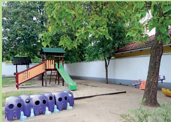
Paks óvodák játszódóvarának felújítására igényelt támogatást

évben a Miniszterelnökség biztosította a fejlesztési támogatást.