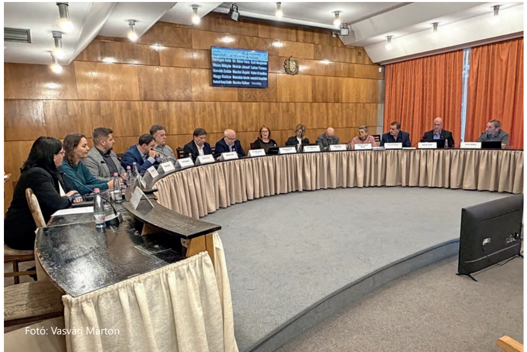
Fotó: Vasvári Márton

Az ülés legsarkalatosabb pontja a 2026. évi költségvetésről és annak végrehajtásáról szóló rendelet meg tárgyalása volt. Paks város költségvetési főösszege 30 milliárd 501 millió 997 ezer forint. Ebből 12,1 milliárdot tesznek ki a helyi adóbevételek; 5,9 milliárd forint a tavalyról áthozott pénzmaradvány. Az államtól működési célra 5,5 milliárd forintot kap a város, ami magában foglalja a normatívákat, a kötelező feladatok és az egészségügyi ellátás állami finanszírozását. Az önkormányzatnál, valamint intézményeinél és cégeinél 737 munkavállaló dolgozik, a teljes bér- és járuléktömeg több mint 8 milliárd forint. A kötelezően ellátandó feladatok 8,6 milliárd, az önként vállaltak pedig 21,5 milliárd forint kiadást jelentenek. Ahogy arról korábban beszámoltunk négy prioritást fogalmaztak meg a költségvetésben. A legfontosabbnak az egészségügyi ellátás finanszírozását (egynapos sebészet újraindítása, komputertomográf vásárlása), a TOP-os pályázatokon elnyert mintegy 7 milliárd forintos területfejlesztési támogatásból a programok, fejlesztések megvalósítását, valamint a két nagy sportegyesület további támogatását tartják. A negyedik prioritás a város hosszú távú jövőjének átgondolása. Elhangzott, hogy Paksra az atomerőmű mellett is szükséges ipart telepíteni, aminek a legfőbb aka-